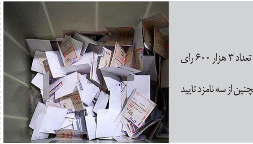
صندوق‌های رأی در تهران

وزیر امور خارجه جمهوری اسلامی ایران: من هم از شما می‌پرسم، توضیح شما به خاطر حملات گسترده به غزه و کشتن بیش از هفت هزار زن و کودک و غیرنظامی (فلسطینی) چیست؟ چرا نباید هر دو طرف را ببینید؟ چرا نباید طرف اشغالگر را ببینید. ما موافق کشتن غیرنظامیان نیستیم. من