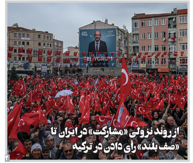
از روند نزولی «مشارکت» در ایران تا (صف بلند) رأی دادن در ترکیه