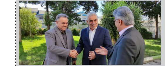
استاندار گیلان با اهدای لوح تقدیر از تلاش‌های رئیس مرکز اورژانس استان تقدیر و تشکر کرد.