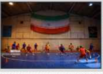
تیم ملی فوتبال ایران در جریان بازی با تیم ملی فوتبال آمریکا در ورزشگاه آزادی، تهران، ۲۰۱۱