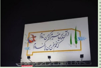
آذین، کتابی از سید محمد تقی میر