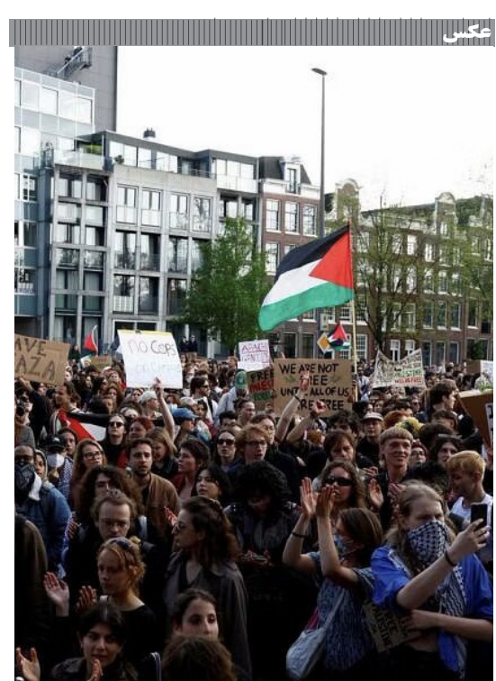
تجمع دانشجویان آمریکا و اروپا در حمایت از مردم فلسطین

وی تاکید کرد: در این هفت و نیم ماه رژیم صهیونیستی هیچ دستاوردی جز شکست در دیپلماسی، میدان و نزد افکار عمومی نداشت و در مقابل، جبهه مقاومت در دیپلماسی، میدان و نزد افکار عمومی الحمدالله موفق و سربلند بوده است.