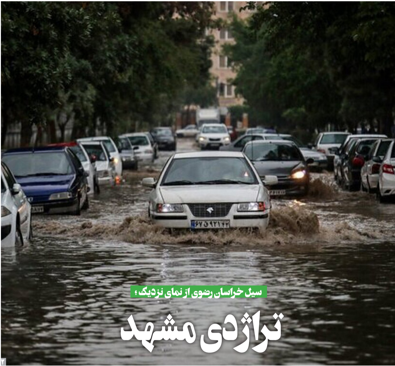
سیل خراسان رضوی از نمای نزدیک؛

مردم گرفتار در هزار پیچ و خم اقتصاد و فرهنگ جامعه خویش حالا مانده اند که ببینند از این مدیران کوتگ فو باز و شومنی هایی که به راه می افتند آیا در این یکسال باقی مانده از دولت سیزده ابی گرم می شود یا باید در انتظار معجزه تغییر دیگری باشند!