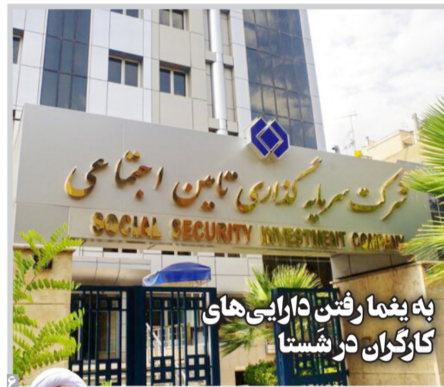
به یغما رفتن دارایی های کارگران در شستا