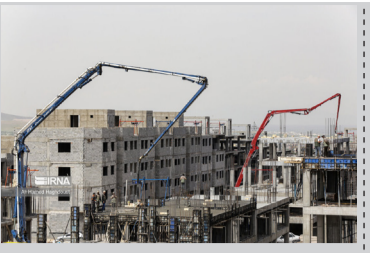
استاندار خراسان شمالی در جریان بازدید از پروژه احداث خط راه‌آهن در استان خراسان شمالی.

استاندار خراسان شمالی: روابط عمومی ها در راستای جهاد تبیین حرکت کنند