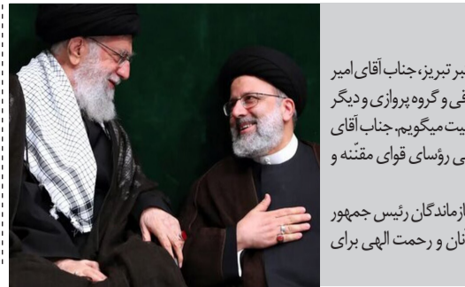
در این حادثه‌ی سنگین شخصیت‌های برجسته‌ئی مانند حجهٔ‌الاسلام آل هاشم امام جمعه‌ی محبوب و معتبر تبریز، جناب آقای امیر عبداللّه‌یان وزیر خارجه‌ی مجاهدو فعال، جناب آقای مالک رحمتی استاندار انقلابی و متدین آذربایجان شرقی و گروه پروازی و دیگر همراهان نیز به رحمت الهی پیوستند. اینجانب پنج روز عزای عمومی اعلام میکنم و به ملت عزیز ایران تسلیت میکنم. جناب آقای مخبر طبق اصل ۱۳۱ قانون اساسی در مقام مدیریت قوه‌ی مجریه قرار میگيرد و موظف است به همراهی رؤسای قوای مقننه و قضائیه تریبی دهند که طرف حادکنر پنج‌روز رئیس جمهور جدیدانتخاب شود.

دولت بایدن همچنین خواستار ایجاد یک کشور فلسطینی –که غزه بخشی جدایی‌ناپذیر آن خواهد بود– شده است؛ پیشنهادی که پس از حمله ۷اکتبر، محبوبیت خود را در اسرائیل از دست داده است. روز شنبه، گانتس با تکرار لفاظی‌های نتانياهو در مخالفت با حاکمیت فلسطین، قول داد که «به هیچ طرف، چه دوست و چه دشمن، اجازه ندهد کشور فلسطین را بر ما تحمیل کند.» گانتس گفت تا زمانی که راه‌حلی دائمی پیدا نشود، غزه باید بطور موقت توسط یک اداره مدنی «آمریکایی–روپایی–عربی–فلسطینی» با نظارت امنیتی اسرائیل اداره شود. گانتس درباره عدم نقش آفرینی تشکیلات خودگردان در آینده غزه به نتانياهو پیوست.