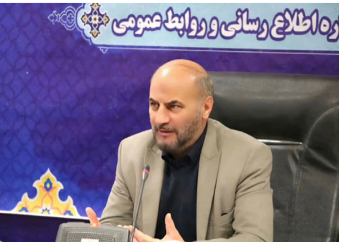
رو اطلاع‌رسانی و روابط عمومی