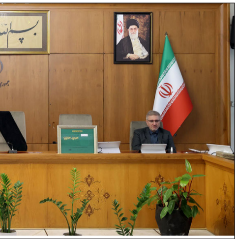
بابک زنجانی در جریان دادگاه خود در زندان