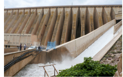
سد سفیدرود یکی از بزرگترین سدهای کشور است که در استان گیلان واقع شده است.

را به زمین های کشاورزی برسانیم. استاندار گیلان با تقدردانی از زحمات کشاورزان و دست اندر کارانی که در عرصه تولید فعالیت می کنند، تصریح کرد: از کشاورزان حمایت می کنیم و بر همین اساس قیمت ها امسال خیلی بهتر از پارسال خواهد بود و مشکلاتی که در سال گذشته داشتند، برطرف شده است.