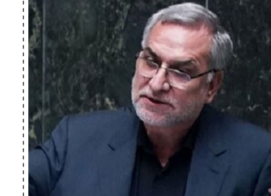
سید محمد خدیو، سخنگوی شورای نگهبان

از اظهارات حجت الاسلام والمسلمین صادقی نیارکی، رئیس کل دادگستری استان گیلان دریافت که در ابرز تاسف از حریق منطقه امام زاده ابراهیم از تلاش‌های هلال احمر، اورژانس و تمامی نهادهایی که در اطفای حریق و ساماندهی مصومان تلاش کردند قدرانی کرد و