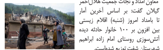
توزیع اقلام زیستی بین خانوارهای حادثه دیده امامزاده ابراهیم گیلان.

معاون امداد و نجات جمعیت هلال‌احمر گیلان گفت: بر اساس آخرین آمار تا بامداد امروز (شنبه) اقلام زیستی بین افزون بر ۱۰۰ خانوار حادثه دیده آتش‌سوزی روستای امام زاده ابراهیم شهرستان شفت توزیع شده‌است.