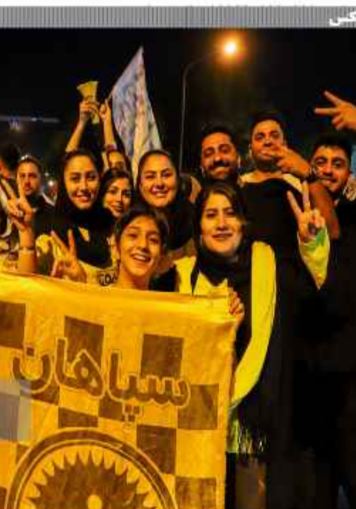
شادی مردم اسفهان پس از قهرمانی تیم سیاهان در جام حذفی

به این ترتیب شاید بد نباشد که سوال مرحوم نرکان درباره تکرار شود: آیا زاکانی عدلها را نمی شناسد؟ واردات طلا، منابع چه کسانی را تامین می کند؟