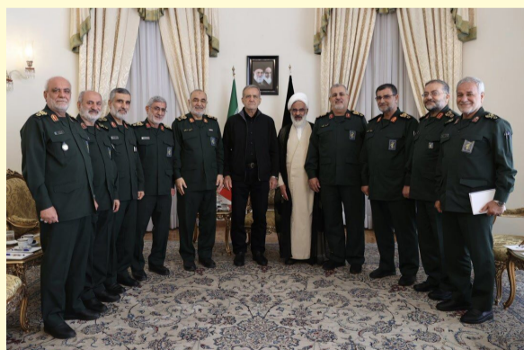
فرماندهان ارشد سپاه پاسداران انقلاب اسلامی در دیدار با رئیس جمهور منتخب، پرچم

آستان مقدس حضرت سیدالشهدا (ع) را به وی هدیه دادند. به گزارش خبرنگار حوزه دولت ایرنا، مسعود پزشکیان رئیس جمهور منتخب با انتشار پیامی در شبکه اجتماعی ایکس از دیدار با فرماندهان ارشد سپاه پاسداران انقلاب اسلامی خبر دارد. پزشکیان در این پیام نوشت: بل یاتار، طوفان یاتار، یاتماز حسینین پرچمی وی افزود: در دیدار امروز برادران عزیزم در سپاه، پرچم مبارک آستان مقدس حضرت سیدالشهدا علیه السلام را از ایشان هدیه گرفتم. رئیس جمهور منتخب تاکید کرد: پرچم آزادگان جهان امروز بر روی دوش ماست. علمدار این پرچم ماندن، همچون عباس (ع) عدالتخواهی، وفاداری، فداکاری و ادب می خواهد. به گزارش ایرنا، سرلشکر سلامی، حجت الاسلام حاجی صادقی، سردار پاکپور، سردار قانی، سردار حاجی زاده، سردار تنگسیری، سردار خادمی، سردار کاظمی، سردار سلیمانی و سردار عابد در دیدار با رئیس جمهور منتخب حضور داشتند.