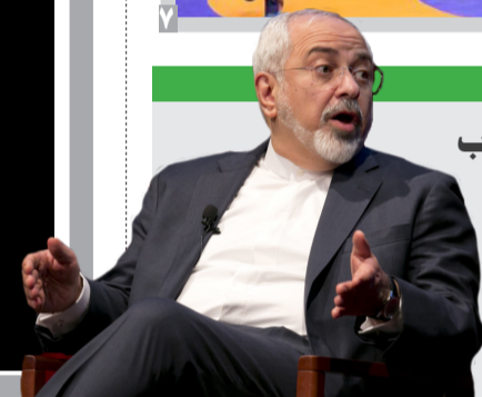
ظریف تشریح کرد،

سازوکار و معیارهای انتخاب کابینه چهاردهم