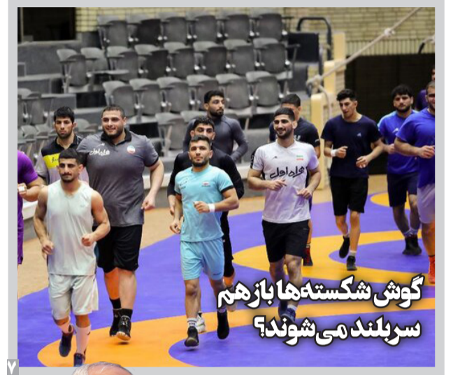
گوش شکسته ها باز هم سر بلند می شوند؟