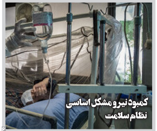
کمبود نیر و مشکل اساسی نظام سلامت