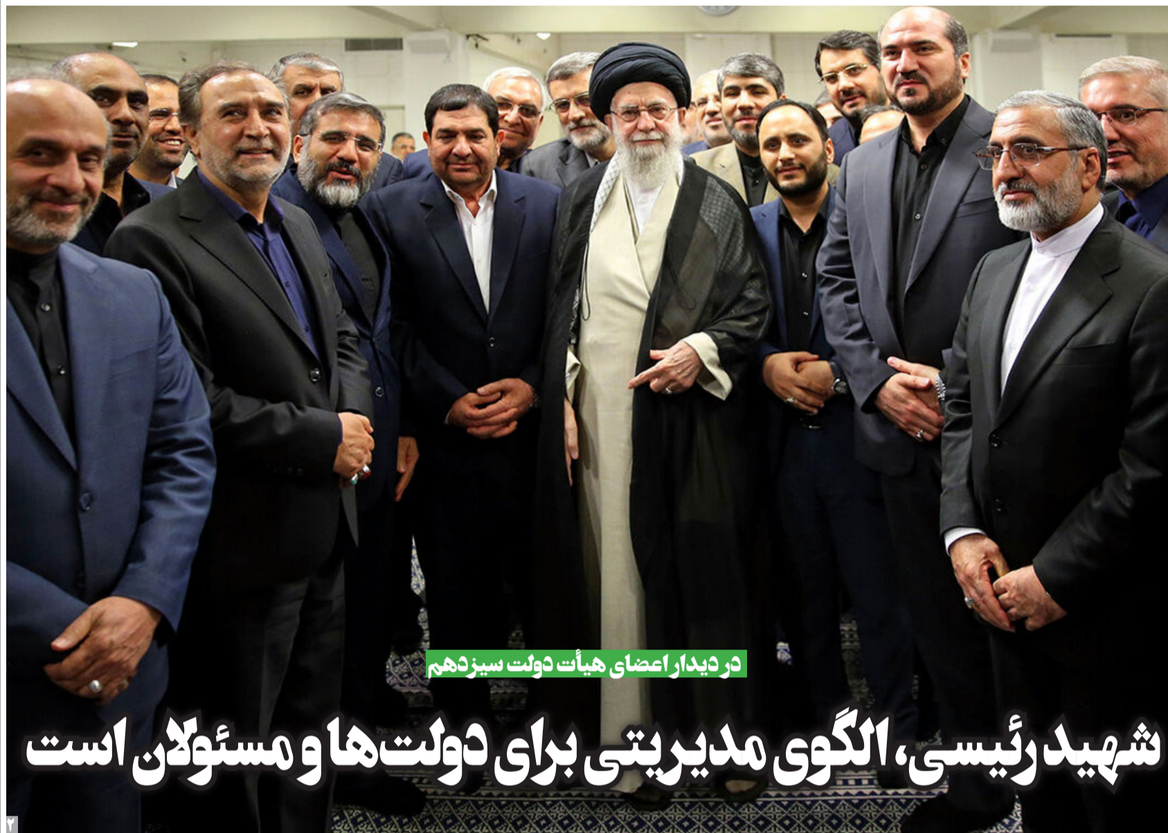
در دیدار اعضای هیأت دولت سیزدهم

دوشنبه ۱۸ تیر ۱۴۰۳ | سال ۲۱ | صفحه ۸ | شماره ۶۷۹۷