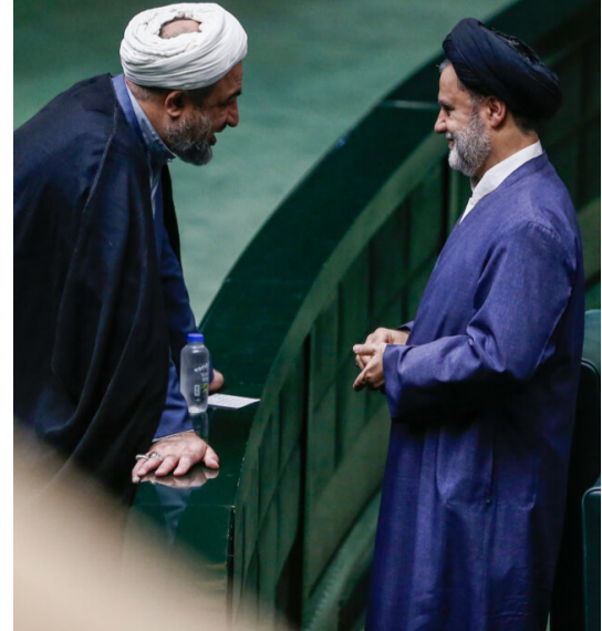
جلسه علنی مجلس شورای اسلامی