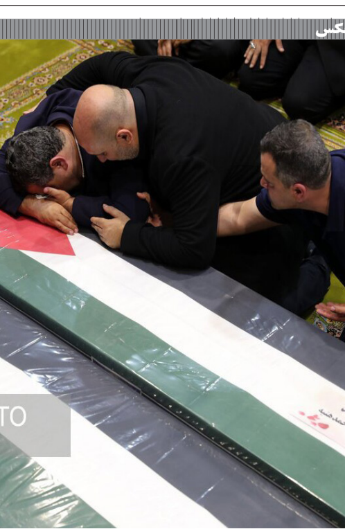
تشیع پیکر اسماعیل هنیه در تهران

وی متذکر شد: اکنون سهم ما در تامین خودروهای سبک کمتر از ۱۵ درصد است این رقم در بهترین روزها و اوج عرضه سی‌ان‌جی به ۲۵ درصد هم رسیده، در سال‌های قبل از کرونا روی عدد حدود ۲۰ درصد بوده‌ایم و اکنون این عدد کمتر از ۱۵ درصد است اما باتوجه به ظرفیت موجود میزان عرضه در سید سوخت خودروهای سبک کشور به حدود ۳۵ تا ۴۰ درصد هم می‌تواند برسد.