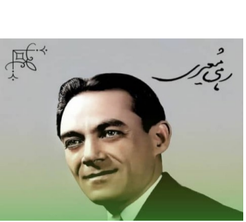
صدای لطیف غزل و ترانه، شاعر بی‌همتای عشق و اندوه یونسئده دکتر فریدن احمدی مدیر مسئول انتشارات بین المللی حوزه مشق

رهی معیری، با نام اصلی محمدحسن معیری، در میان غزلسرایان و ترانه‌پردازان ایران زمین، جایگاه ویژه‌ای دارد. او نه تنها در سرودن اشعار عاشقانه و دل‌نگارانه، بلکه در خلق تصنیف‌های ماندگاری که با روح موسیقی ایرانی درمی‌خفت، نام خود را جاودانه کرده است. در یادداشت پیش‌رو، به زندگی، آثار و اندیشه‌های این شاعر برجسته پرداخته و از زیبایی به او می‌نگریم که شاید کمتر مورد توجه بوده است.