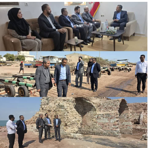
معین - بندرعباس

مدیرکل شیلات هرمزگان در دیدار با بخشدار هرمز با حضور معاون صید و بنادر ماهیگیری شیلات هرمزگان، رئیس اداره روابط عمومی، هماهنگی و امور پرسنلتاهی شیلات استان، رئیس شیلات شهرستان بندرعباس و مدیرعامل اتحادیه تعاونی های صیادان هرمزگان از برگزاری جشن شکرگزاری صید میگو در جزیره هرمز در آبانماه ۱۴۰۳ به شکرانه ۲۶۶ هزار تن صید و فصل صید میگو هرمزگان با حضور جامعه صیادی، مقامات کشوری و استانی خبر داد.