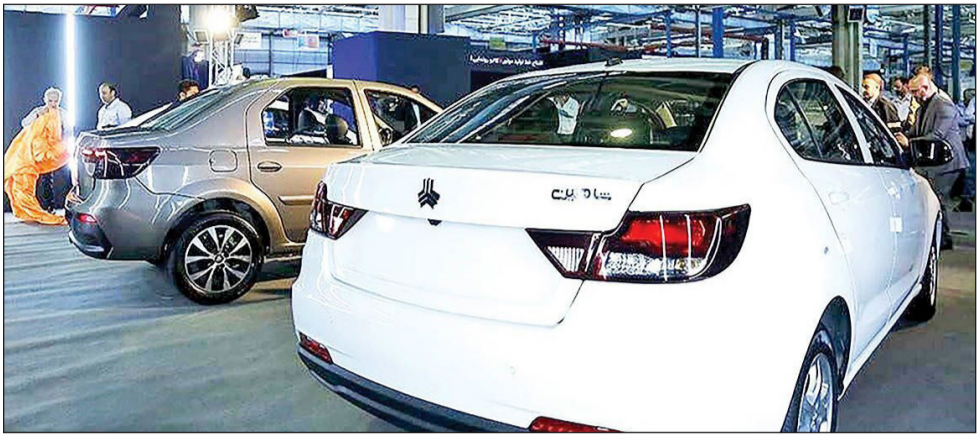
خودروهای تولید داخل در نمایشگاه خودرو تهران

با این‌حال، سیاستگذار هنوز که هنوز است در قیمت‌گذاری خودرو دخالت می‌کند و هر وقت صلاح بداند و بر حسب سلیقه، مجوز اصلاح قیمت خودرو را می‌دهد.