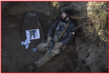
ارتش اوکراین در جریان نبرد در شرق اوکراین

گزارش‌های جدید از وضعیت ارتش اوکراین نشان می‌دهد که ۷۰ درصد نیروهای ارتش آماده امتیاز دادن به روسیه و واگذاری قلمروهای از دست‌رفته هستند.