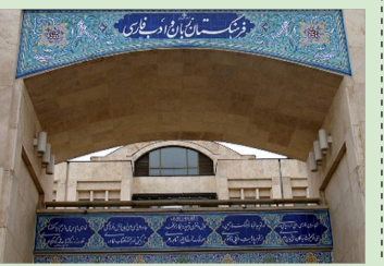
تجزی و توستی