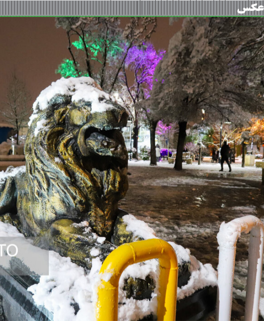
جشنی در سن پترزبورگ

دانشمند گفت: تا زمانی که راه منطقی پیدا نکنیم که صادر کننده ارز خود را با نرخ منطقی عرضه کند، همیشه صادر کننده راهی پیدا می‌کند که ارز را به سامانه تحت نظر بانک مرکزی تحویل ندهد، چون خیلی کالاهای ماهیت فروش امانی دارد مانند فرش، صادر کننده فرش، آن را صادر می‌کند و می‌گوید یک سال فرصت داری بفروشی اگر نه پس بده! پس لازم نیست ارز حاصل از صادرات را فی القور به سامانه تحویل دهد. وی در مورد ممنوعیت صادرات پسته ایران توسط اتحادیه اروپا گفت: در حال حاضر پسته آمریکایی با در اثر سیاست گزافی‌های غلط ایران، جای پسته ایرانی را در بازار اروپا گرفته است، برخی تاجر به بازار اروپا پسته درجه ۴ صادر کردند به نام پسته درجه ۱ و با استفاده از این صادرات، امتیاز واردات کالا را گرفتند، یعنی سود قبیضه از امتیاز واردات کالا تامین شد، نتیجه این شد که حتی خودروسازان ما نیز به صادرات پسته روی آوردند و نام پسته ایرانی در اروپا لکه دار شد. در حال حاضر نیز محدودیت‌های زیادی برای صادرات پسته ایرانی اعمال شده و ممکن است در آتیه این محدودیت‌ها افزایش بیابد و با اروپا کالا واردات پسته ایرانی را ممنوع نماید.