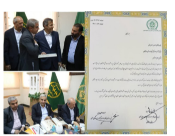
معین - بندرعباس

رئیس سازمان نظام مهندسی کشاورزی و منابع طبیعی کشور از مدیرکل شیلات هرمزگان در راستای پیشبرد اهداف کشاورزی استان در حوزه شیلات تقدیر کرد.