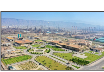
معین - بندرعباس

شرکت نفت ستاره خلیج فارس موفق به کسب رتبه نخست در حوزه حفاظت محیط زیست میان شرکت‌های پالایشی کشور شد.