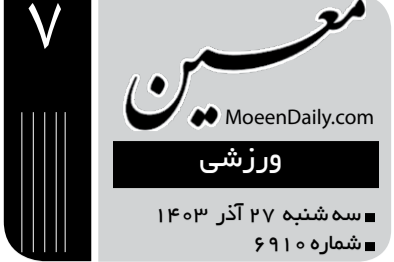
سه شنبه ۲۷ آذر ۱۴۰۳