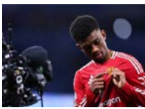
روی کین، ستاره سابق منچستربونایتد، می‌گوید نگران آینده آاماد دیالو است.

نگرانی کین: پدیده یونایتد را الکی بزرگ نکنیدبه گزارش «ورزش سه»،