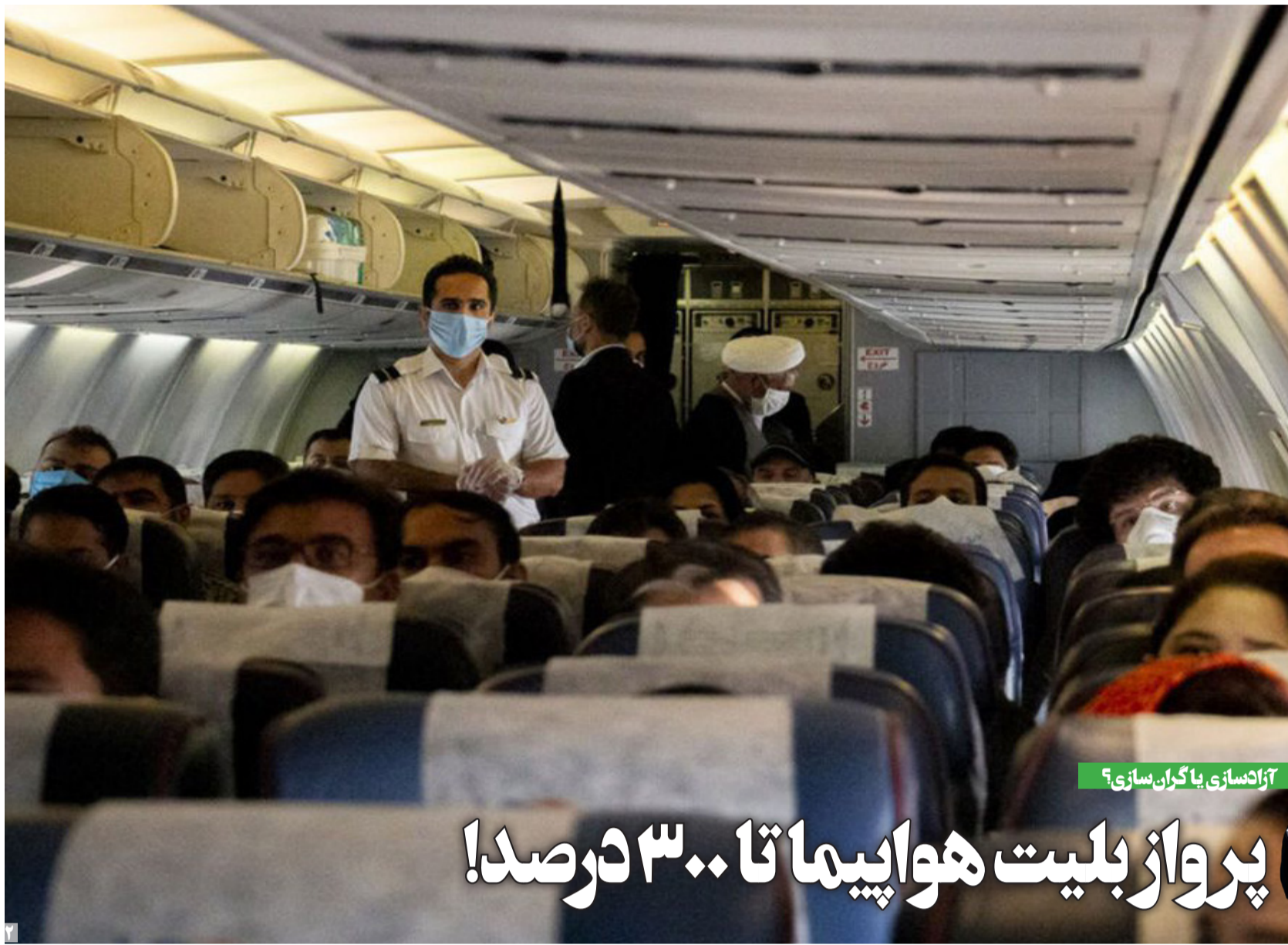
آزادسازی یا گران‌سازی؟