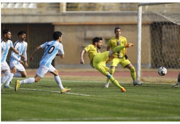
تیم فوتبال فرد البرز