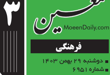
ادبیات و کتاب

میرعبالدین در کتاب خود می‌گوید:علوی می‌خواست نویسنده شود.ماهر بار مانی سدره او برای آفرینش ادبی شد.سیاست‌ و زنان، فعالیت حزبی، تبعیدو پیشه تدریس او در ۲۸ بهمن ۱۳۷۵(۱۷ فوریه ۱۹۹۷) در سن نود و سه‌سالگی به عرضه قلبی در گذشت و در گورستان برلین به خاک سپرده شد.در حالی که این حسرت را به دل داشته «وقتی می‌بینم که همکاران من به آثار پارلزشی نوشته‌ام، دلم آکنده از غم می‌شود که چتنه من خالی است و از خود می‌پرسم چه شد که می‌خواستی نویسنده بشوی وسط زماندی.»