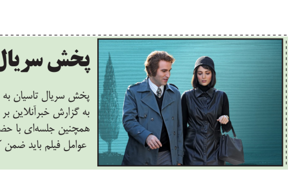
سینما و تئاتر