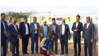
فاز دوم پارک دانشجو در بندرعباس

فاز دوم پارک دانشجو در بندرعباس به بهره برداری می رسد