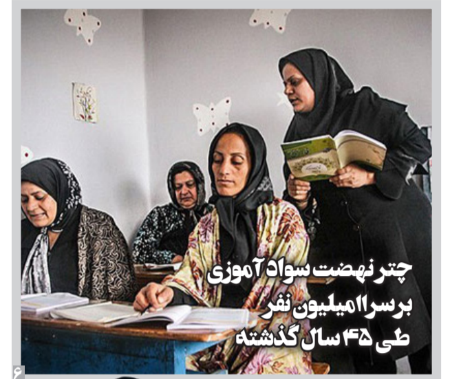
چتر نهضت سواد آموزی برسرا ۱۱ میلیون نفر طی ۳۵ سال گذشته