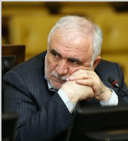
وزیر نیرو، سیدرضا حسینی

این تحلیلگر ارشد حوزه انرژی کشور در خصوص وعده وزیر نیرو برای پایان ناترازی‌های برق تا زمستان سال آتی گفت: «آقای علی‌آبادی همه جور وعده‌ای داده و همه جور جهت‌گیری هم داشته‌اند. ایشان حدود یک ماه پیش گفتند که تابستان سختی در پیش خواهیم داشت و خدا کمک کند که هوا