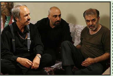
سینما و تئاتر