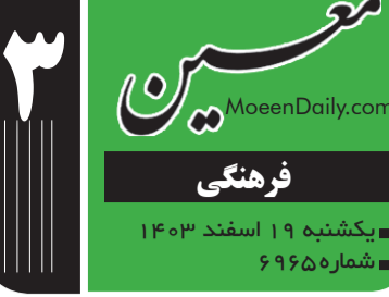
فیلم و سریال