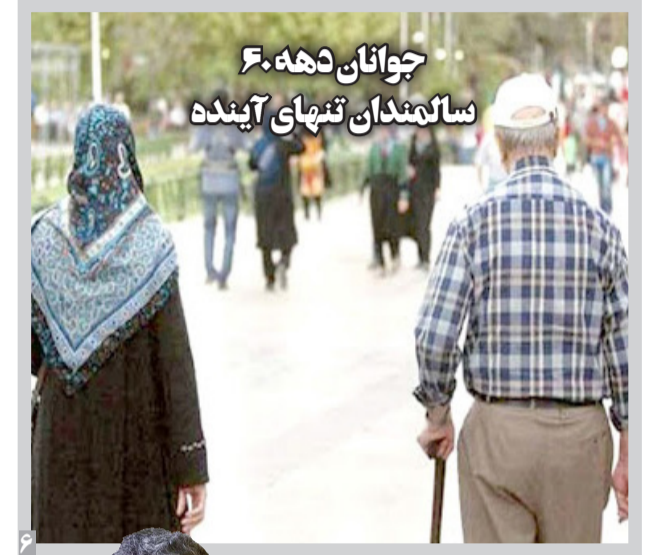
جوانان دهه ۶۰ سالگردان تنهای آینده