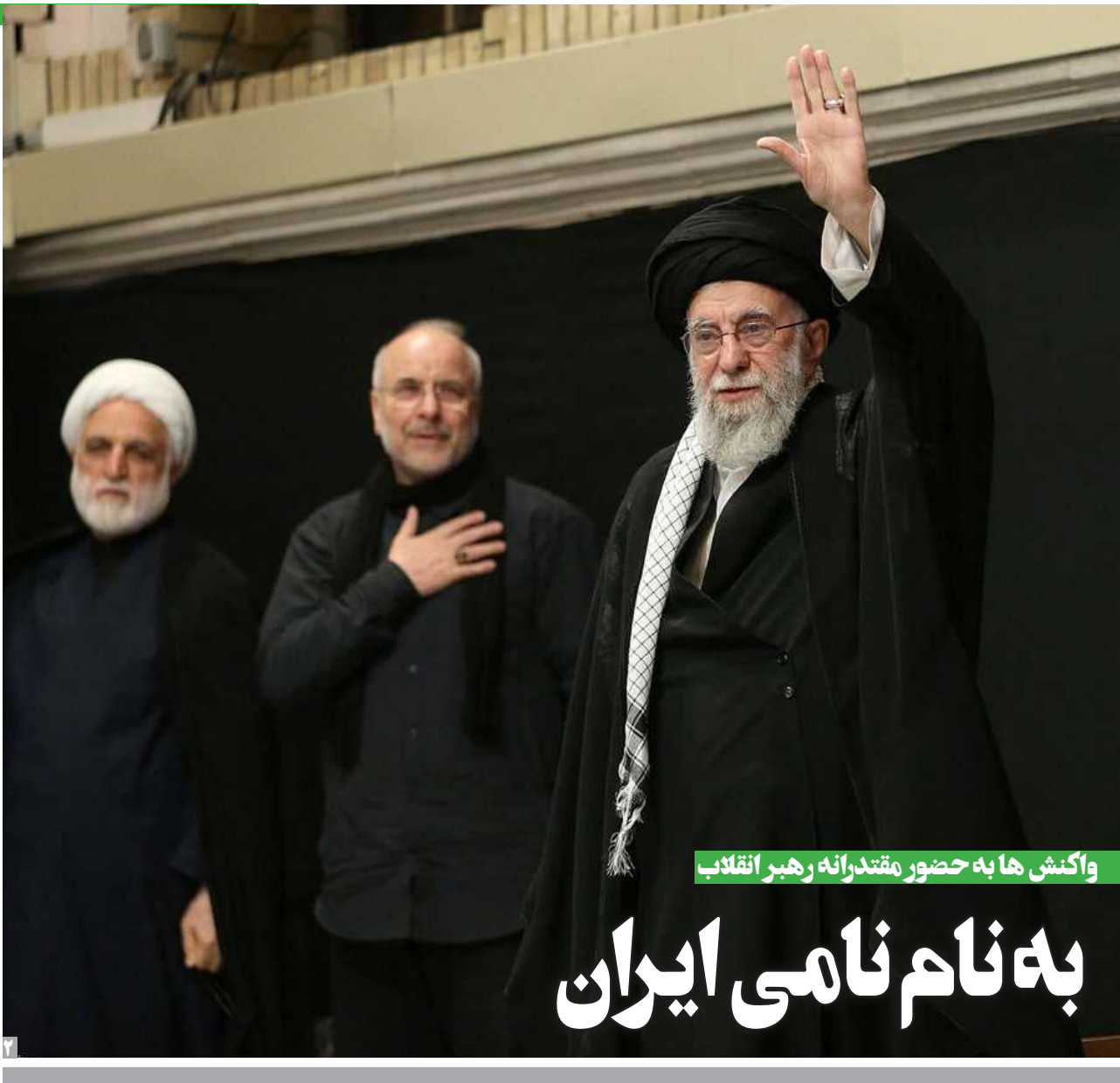
واکنش‌ها به حضور مقتدرانه رهبر انقلاب