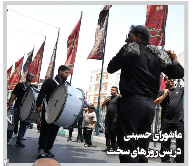
عاشورای حسینی در پس روزهای سخت